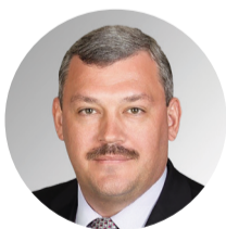
Сергей Гапликов Глава Республики Коми

«Новые меры поддержки позволят семьям с детьми быть уверенными в своём будущем.»